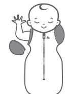
SWADDLE UP™ TRANSITION BAG