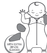
SWADDLE UP™ TRANSITION SUIT